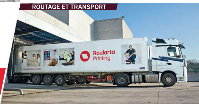
ROUTAGE ET TRANSPORT